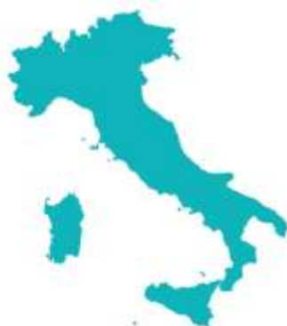
Distribuzione per grado scolastico (%) a.s. 2016/2017